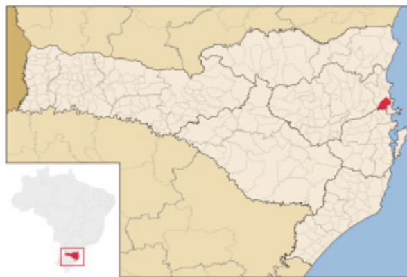
Localização do município no estado

Camboriú está localizada no estado de Santa Catarina, na região Sul do Brasil, situando-se a cerca de 90 quilômetros da capital Florianópolis. Possui coordenadas geográficas aproximadas de 27°01'31" de latitude sul e 48°39'16" de longitude oeste, com altitude média de oito metros acima do nível do mar.