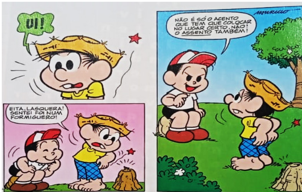
(Gibizinho da Mônica, nº73, p.73)

Para ficar mais claro, leia os quadrinhos: