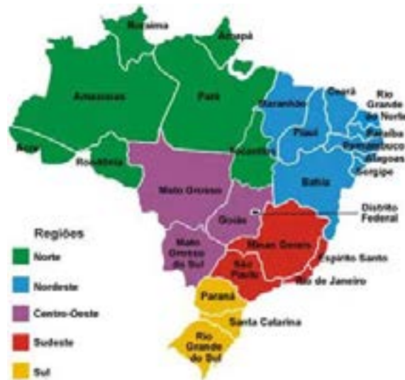
Mapa político que mostra as regiões do Brasil