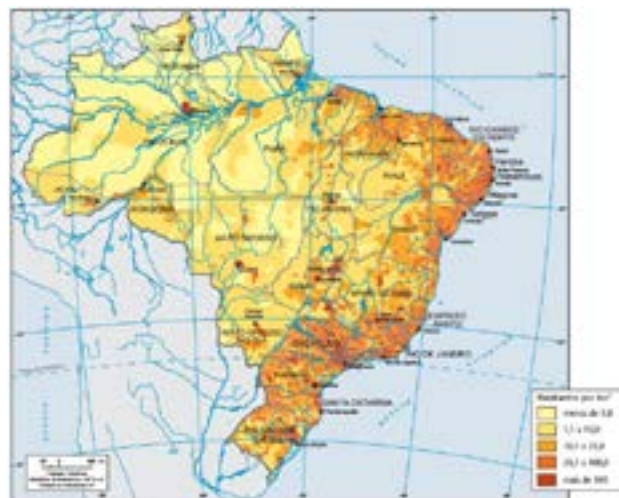
Mapa Demográfico do Brasil